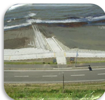
海岸へ降りるスロープ