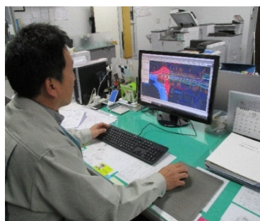
パソコンで設計図面を作っています