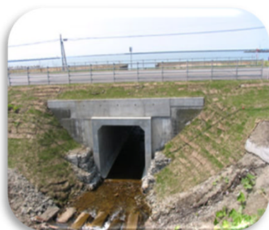
ボックスカルバート